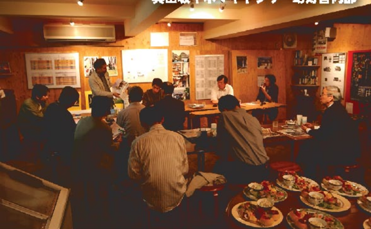
真田坂キネマギャラリー 幻灯舎内部