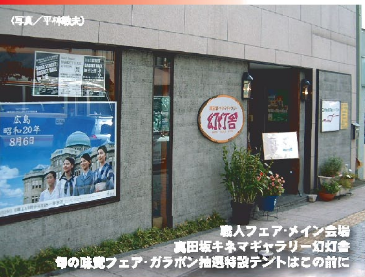
職人フェア・メイン会場 真田坂キネマギャラリー 幻灯舎 旬の味覚フェア・ガラポン抽選特設テントはこの前に